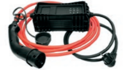
3,7 kW/16 A, Typ EF, 6m Teile-Nr.: 98 358 568 80