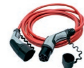
22 kW/32 A, 3-phasig, 6m Teile-Nr.: 98 374 977 80