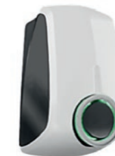
22 kW/32 A, 3-phasig, Smart Teile-Nr.: 98 356 626 80