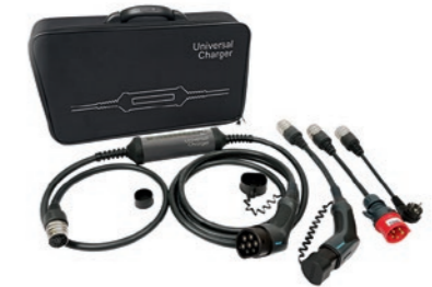
1,8–22 kW, inkl. Typ-2-Adapter, CEE16-Adapter, Typ-EF-Adapter und Transporttasche Teile-Nr.: 98 357 837 80