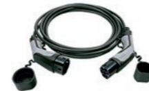
7,4 kW/32 A, 1-phasig, 6m Teile-Nr.: 98 285 421 80