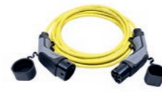
11 kW/16 A, 3-phasig, 6m Teile-Nr.: 98 374 976 80