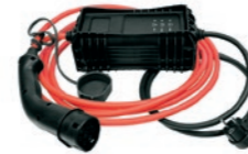
1,8 kW/8 A, Typ EF, 6m Teile-Nr.: 98 237 808 80