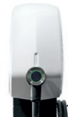
11 kW/16 A, 3-phasig, Smart und Kabel Teile-Nr.: 98 356 627 80