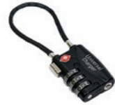
Sicherheitsschloss für Universal Charger