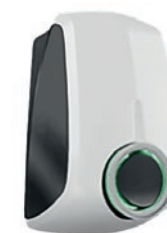
22 kW/32 A, 3-phasig, Smart Teile-Nr.: 98 356 626 80