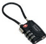
Sicherheitsschloss für Universal Charger