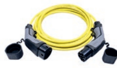
11 kW/16 A, 3-phasig, 6 m Teile-Nr.: 98 374 976 80