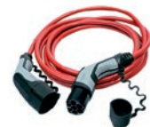
22 kW/32 A, 3-phasig, 6 m Teile-Nr.: 98 374 977 80