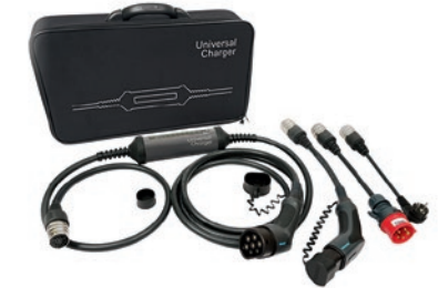
1,8–22 kW, inkl. Typ-2-Adapter, CEE16-Adapter, Typ-EF-Adapter und Transporttasche Teile-Nr.: 98 357 837 80