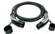
7,4 kW/32 A, 1-phasig, 6 m Teile-Nr.: 98 285 421 80