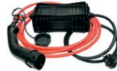
1,8 kW/8 A, Typ EF, 6 m Teile-Nr.: 98 237 808 80