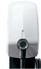
11 kW/16 A, 3-phasig, Kabel Teile-Nr.: 98 356 629 80