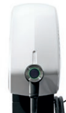
11 kW/16 A, 3-phasig, Smart und Kabel Teile-Nr.: 98 356 627 80